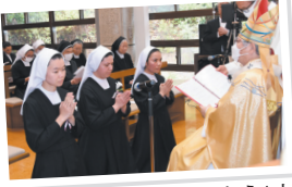
2人はベトナムから、もう1人はブラジルから導かれた誓願者

3月18日、本部祈りの家(みこころの聖堂)で集う50人に見守られ、初誓願・終生誓願式が行われた。