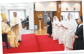
厳肅な空気の中、初誓願宣立

3月23日、仁川本部修道院大聖堂で、前田万葉大司教をはじめ4人の司祭の共同司式により、3人の初誓願宣立式と感謝の祭儀が行われた。