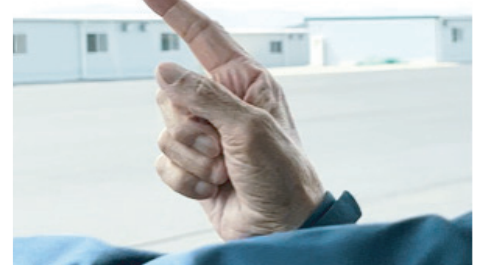
「ここにいつも止めていた」

綺麗に舗装されたアスファルトの上で静かに車を止めて「ここは船溜まりだった。俺の船はここにいつも止めていた」と思い詰めた表情で言われた。そこは埋め立てられ当時の様子は跡形もない。そして小さくつぶやくようにこう言われた。「もう、戻れねえよ」 (シナピス 原慶子)