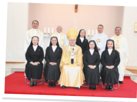
初誓願、奉獻生活の第一歩

祈りをこめて読みあげる誓願文に心打たれた。式後の祝賀会は家庭的な雰囲気の中で、和気あいあいと喜びを分かち合うことができ、楽しいひと時であった。神に感謝！