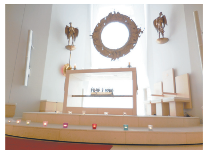
祈りの歌をくり返し 人びとをつなぐテゼの祈り