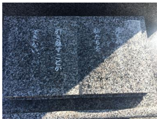
カトリック大阪大司教区 ARCHIDIOECESIS CATHOLICA OSAKAENSIS (題字は前田枢機卿様の筆)