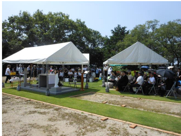
2018年6月9日祝福式・納骨式