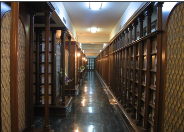
内部[左側が納骨室(大)・右側が納骨室(小)] (5寸壺が大には3壺、小には2壺入ります)