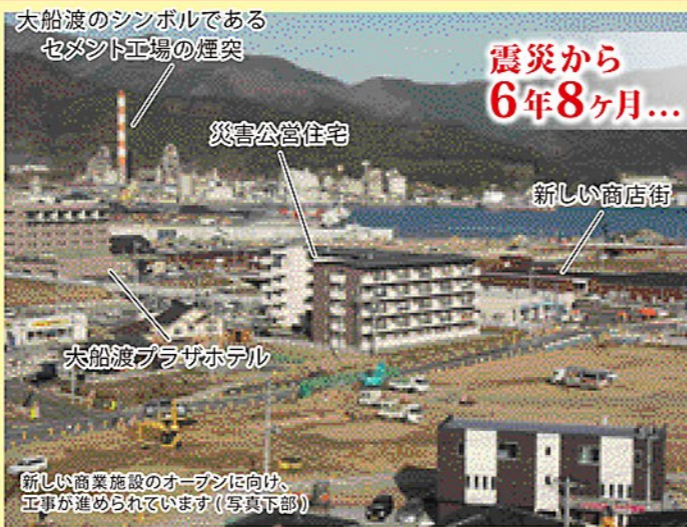
新しい商業施設のオープンに向け、工事が進められています(写真下部)

て幸せだ」と、とても喜んでいただきました。また、皆さんが踊りの知識も豊富なので、お茶っことも盛り上がりしました。