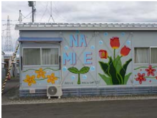
浪江町民が暮らす福島市にある仮設住宅

「わたしたちは同じ被災者なのです」とのことばを聞き、共に祈り、共に歩む教会の姿を感じました。福島の地方新聞は放射線量測定結果など詳しく掲載され、その違いに驚きます。