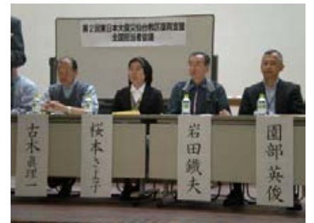
第1部のシンポジスト

そこで私たち二本松教会の信徒たちで、「福島やさい畑～復興プロジェクト～」を立ち上げ、主に首都圏のカトリック教会にご協力をいただき、安全確認のできた福島の野菜、果物などを販売しています。これを私たちは、事業としてやっています。それは、福島復興のために、県内で仕事ができることが重要課題であり、自活の道を開いていくことが最優先課題であると考えているからです。