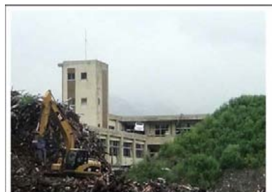
大槌の小学校、瓦礫の山が復興の遅れを物語る

不自由さを受け入れ、今後の不安はありながらも、私たちを温かく迎えてくださり、多くの方の奉仕に感謝しておられる姿に、心が和みました。その後、被災地を南下。入り江ごとの瓦礫の山また山、家の土台だけが残された平地。昨年7月、シスターズリレーで塩釜ベースにお世話になった折に見せていただいた被災地とほとんど変わらない様子に唖然としました。瓦礫の山の中で小さく見える重機での作業を目にし、気の遠くなるような現実の中で、日々の小さな積み重ねが、復旧復興につながることを信じて取り組んでおられることを思い、一日も早い実現を祈りました。