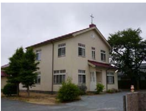
南相馬市にある原町教会、原発から最も近い教会

廃業の宿もある温泉地の風評被害も大きなものですが、日本人の絆を問い直しながら、ピンチの時に、この町で育てられたことを感謝し、次世代に故郷を残そうと奮闘されるホテル経営者の言葉は印象的でした。