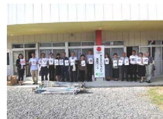
今後のベース歩みに神さまの恵みを願いつつ！

今後当ベースは、仮設住宅のカフェサロンへのボランティア派遣や社協のボランティア派遣のためのベースとして、また独自の活動の拠点、福島の現状を発信する場として、幅広い活動を行っていく予定です。