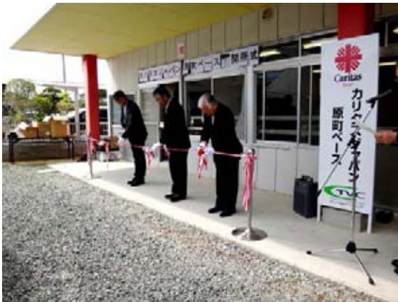
幸田司教、平賀司教、当地の社協所長によるテープカット！

CTVC(カトリック東京ボランティアセンター)運営の「カリタス原町ベース」が、東日本大震災の復興支援のための8つ目のベースとして、2012年6月1日、福島県南相馬市原町区に誕生しました。当日は仙台教区から