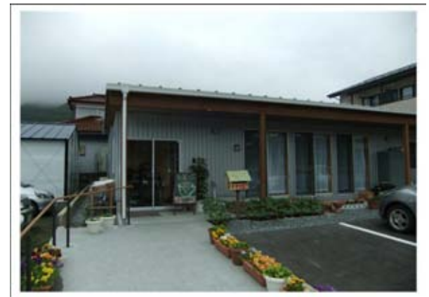
大船渡ベース「地の森いこの家」

大船渡に着いてびっくりしたのは、その復興の早さだ。去年の夏にうかがった時には、津波に呑まれて何もかもぐちゃぐ