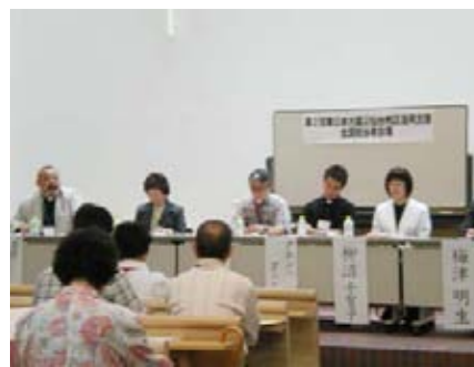
第2部のシンポジスト

この現状が知らされていない全国の人々に、最前線で活動している私たちだからこそ、発信できるものがあります。私たちが目で見、聴き、感じたことを伝えていきたいと思っています。