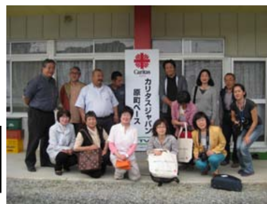
参加者全員で！活動が続きまうように！

二本松教会では風評被害で経営困難な農家の支援を、日曜日に東京、神奈川のカトリック教会へ自ら運搬・販売という形で行っています。いわき教会では仮設住宅を中心にきめ細やかな支援を行っています。原町教会は仮設へ