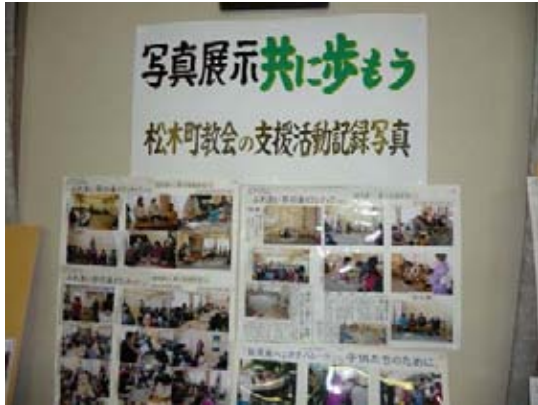
松木町教会の震災後の歩み

第2回全国担当者会議に先立って、福島県北部を視察する2コースは、6月11日午後1時にカトリック松木町教会に集まりました。そこで抹茶とお菓子を頂戴した参加者は、松木町教会「愛の支援グループ」のふれあい茶の湯ボランティアの一部