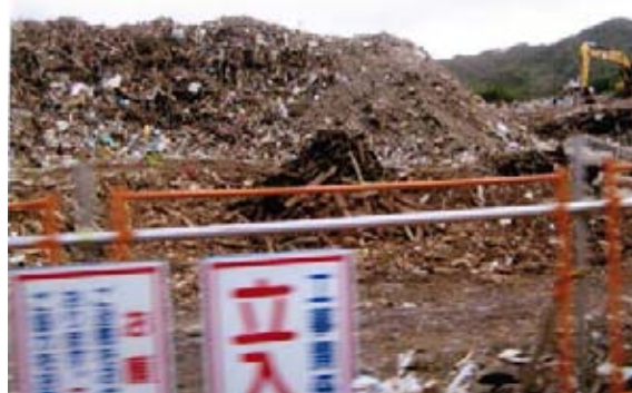
まだまだ片付かない瓦礫の山、不信感と他人事の象徴！

「助かって道路にいたら、トラックが来て、乗るように促され、山間の地区に連れていかれて、3日間その地域の方が炊き出しをしてくださり、温かいご飯をいただきました」。その後、仮設に入るまで、地域の方の物資援助で、自分たちで炊いて食べることができ、震災に遭わなければ知らなかった人々の温かさを実感する日々だったことなど、しみりと語ってくださいました。