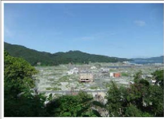
大槌の町、白く見えるのは建物の土台のコンクリート

去る6月11日、初夏のさわやかな風のもと、再び大槌町へ降り立った。去年の夏からずっと大槌の様子を見て来たが、ずいぶん明るくなったような気がした。季節がら陽射しが明るいということもあるかも知れないが、瓦礫などがずいぶん片