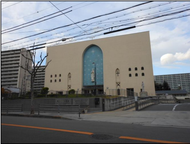
大阪カテドラル聖マリア大聖堂 正面